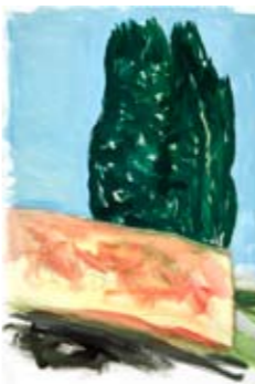
1998 - Toscane, Italië. Gouache.