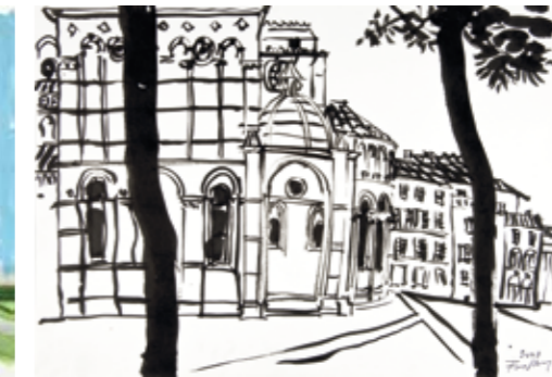
2000 - Lucca, Italië. Penseel.