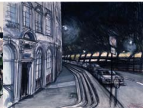
1983 - Lyon, Frankrijk. Gemengde techniek.