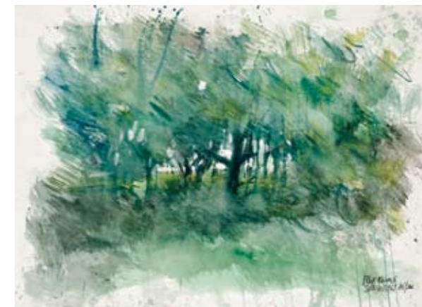
1988 - Schimmert, Zuid-Limburg. Aquarel.