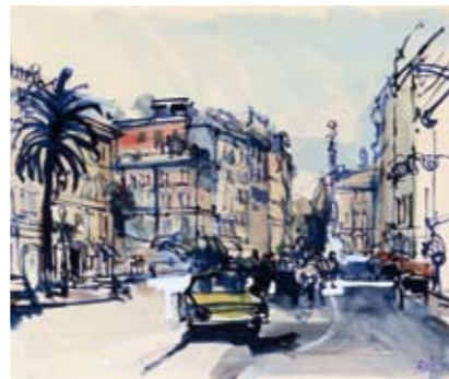
1974 - Rome, Spaanse trappen. Aquarel.