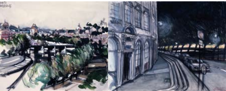
1981 - Tiber, Rome. Gemengde techniek.