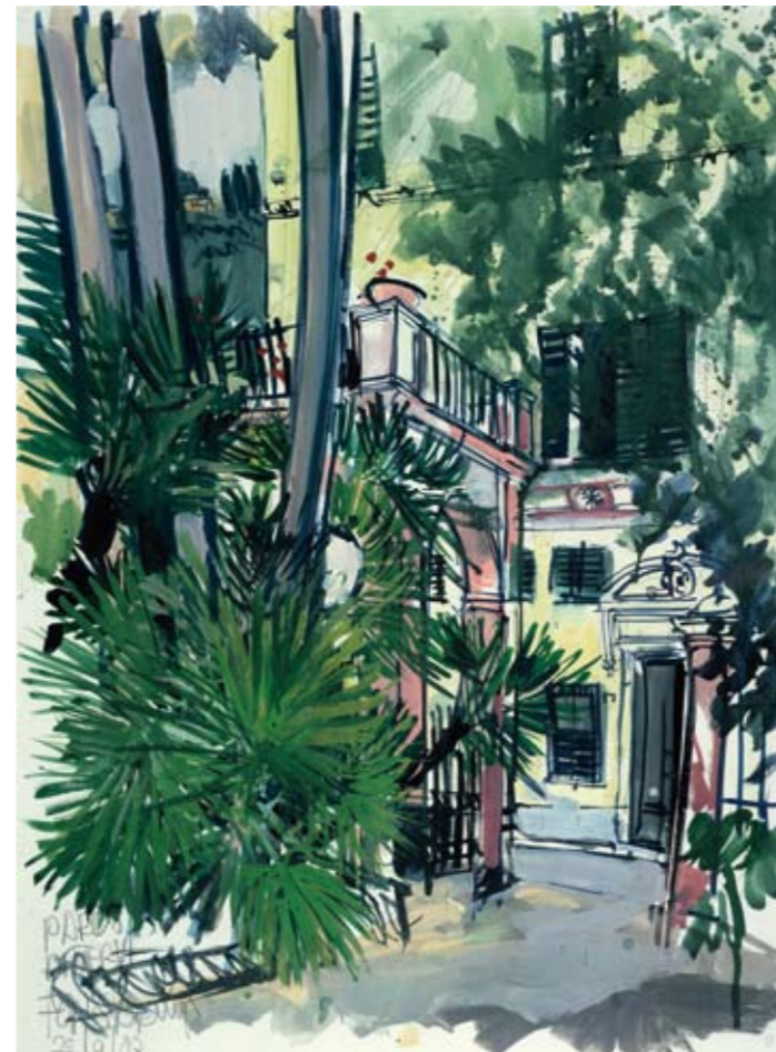
1983 - Nervi, Italië. Aquarel.