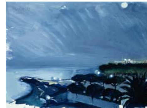
1983 - Ceriale, Italië. Gouache.

gan en de campagne die toeristen uit heel Nederland naar Limburg moet trekken. Voor de Maastricht-Brussel Express, de nieuwste snelle treinverbinding die Maastricht ieder uur rechtstreeks met Brussel, verbindt ontwikkelde hij de introductiecampagne waarvan hier een van de uitingen. Momenteel wordt er gewerkt aan de nationale campagne voor de regiobranding Zuid-Limburg.