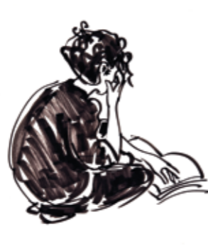
1998 - viltstift.