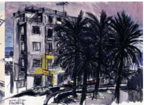
1983 - Levanto, Italië. Krijt, aquarel.